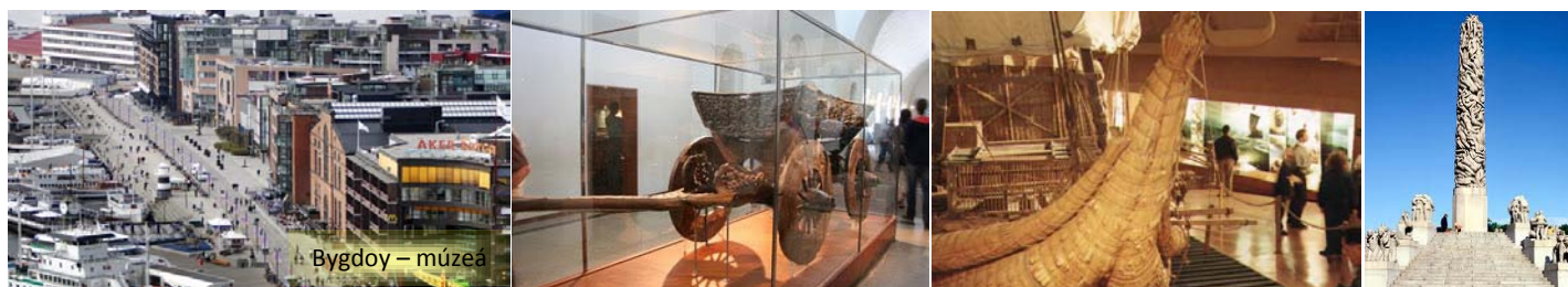
Bygdøy – múzeá

1. – 2.deň - STREDA – ŠTVRTOK 29.08. – 30.08.2012 - V skorých ranných hodinách odchod cez Poľsko a Nemecko do Sassnitz. Plavba do Trelleborgu a cesta pozdĺž pobrežia Švédska okolo Götteborgu. Príjazd do centra Osla – prechádzka modernou časťou Aker Brygge . Prehliadka známych múzeí na polostrove Bygdøy , návšteva Frogner parku so zbierkou unikátnych sôch sochára Gustava Vigelanda. Pevnosť Akershus, prechádzka pešou zónou okolo univerzity, parlamentu a iných pamätihodností. Ubytovanie + večera: Honefoss .