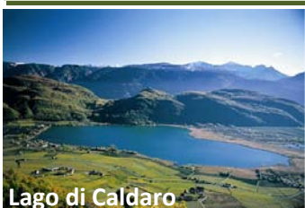
Lago di Caldaro