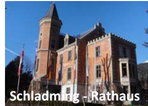
Schladming - Rathaus